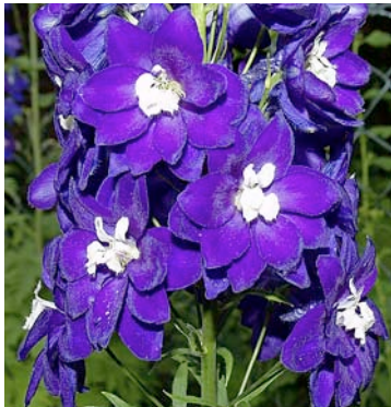
Edel wie Lapislazuli: Rittersporn hat auch kräftiges Dunkelblau zu bieten.