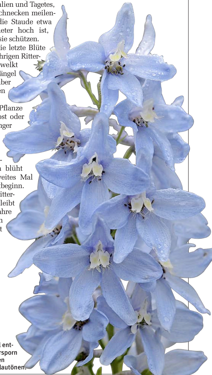
Dem Himmel entgegen: Rittersporn brilliert in den schönsten Blautönen.