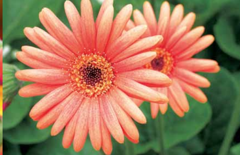
Endlich gibt es Gerberas, die man erfolgreich in den Garten oder in Töpfe im Freien setzen kann. Ihre Blütenfülle ist umwerfend. (Kientzler)

letztes Jahr mit der lieblichen Schneepinzessin geteilt! Der herrliche Duft ihres Honigparfums liegt mir jetzt noch in der Nase: Der schneeweisse Duftsteinrich, Lobularia 'Snow Princess', hat von Mai bis zum ersten Frost (und noch einige Tage darüber hinaus) mit einer schier unglaublichen Blütenfülle brilliert und dabei die umgebenden Blüher gekonnt unterstrichen. Bei Ihrem Plantiance®-Gärtner finden Sie noch viele weitere Neuheiten von Kientzler.