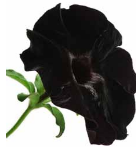
Petunien sind immer wieder eine Überraschung wert: Die samt-schwarzen Blüten von 'Black Velvet' stehen in intensivem Kontrast zur lieblichen Farbkombination die uns 'Surprise Lemon Pink' zeigt. (beide von Florensis/Ball)

Von beeindruckender Farbenpracht und Wüchsigkeit haben sich die Kombinationen der bekannten und beliebten 'Confetti®'-Serie erwiesen. Hier eine ganz neue Zusammenstellung namens 'Nightlights', einfach toll! (Redfox/Dümmen)