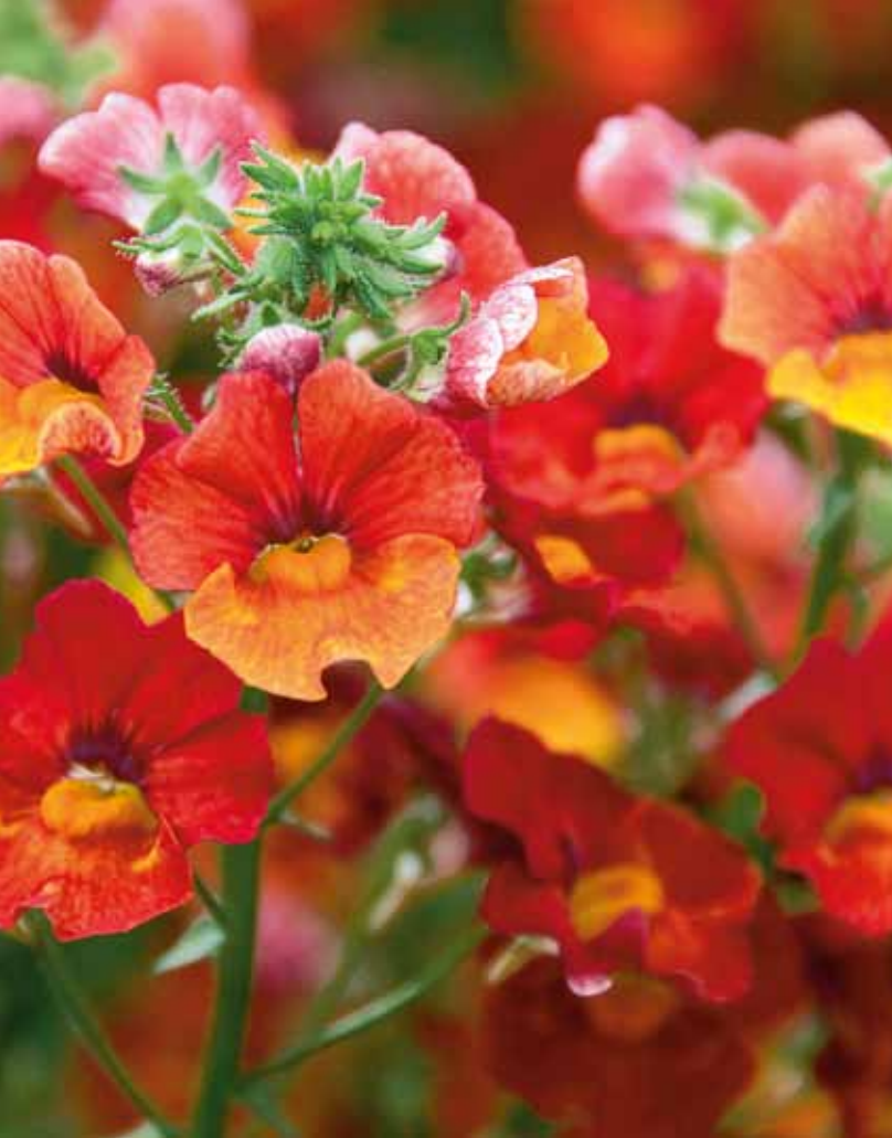
Fruchtig-frisch kommen diese neuen Nemesien daher: 'Sunsatia'™ New Papaya zeigt ein eindrückliches Farbenspiel von Gold bis Papaya-Orange. Zum 'reinbeissen!' (Kientzler)