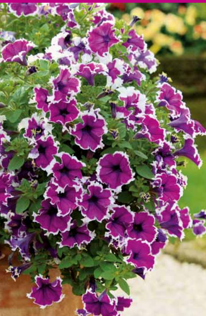
Die Designer-Petunie 'Corona Amethyst' wird sich bestimmt zu einem Renner der Saison entwickeln. (Kientzler)

Die Plantiance-Gärtner des JardinSuisse produzieren verteilt über die ganze Schweiz Blumen und Pflanzen in Topqualität. Schweizer Pflanzen machen länger Freude – und tragen immer öfter das Label Plantiance. Es steht für erstklassige Schweizer Qualität und damit deutlich längere Haltbarkeit sowie vitales Wachstum. Durch den Kauf von Plantiance-Qualität sichern Sie ferner wertvolle Arbeitskräfte und helfen damit auch mittelfristig, eine erstklassige Fachberatung von ausgebildeten Gärtnerprofis sicherzustellen. Informieren Sie sich auf www.plantiance.ch über Plantiance-Produkte, exklusiv erhältlich in Ihrer Gärtnerei und im Garten-Center.