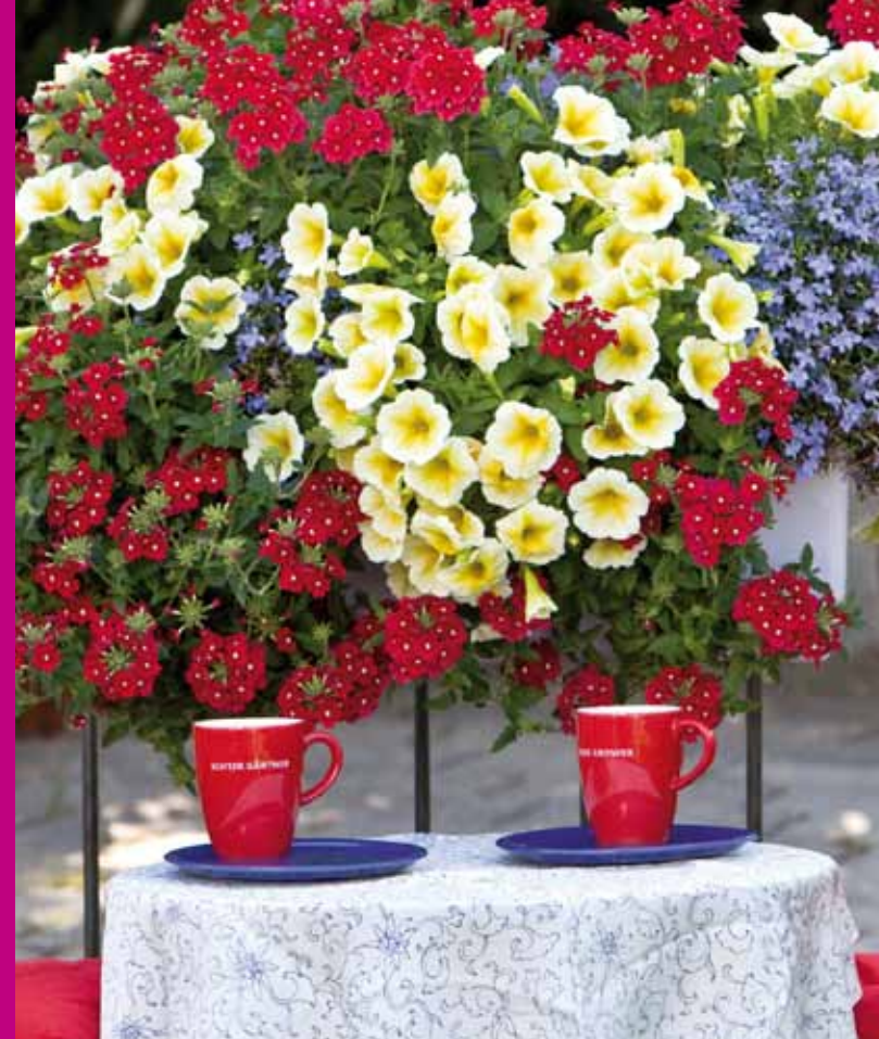
Zauberhafte Balkonidylle mit der neuen Confetti®-Kombination 'Watercolours'. (Dümmen)

Die vorgestellten Sorten sind im Fachhandel, in Garten-Centern und Gärtnereien erhältlich. Je nach Lieferant unterscheidet sich das Angebot an Jungpflanzen. Interessante Websites: www.kientzler.de , www.florensis.com , www.greenpflanzenhandel.ch , www.kiepenkerl.de , www.volmary.com