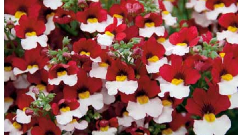
Farbenfrohe Nemesie 'Sunsatia™ Cherry on Ice' (Kientzler)