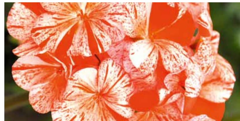
Die Balkongeranie 'Flic Flac' sieht aus wie ein Soft-Ice am Stiel. Herrlich erfrischend ist ihre Farbzusammenstellung. Neben der abgebildeten Sorte gibt es auch eine in Violett. (Endisch)