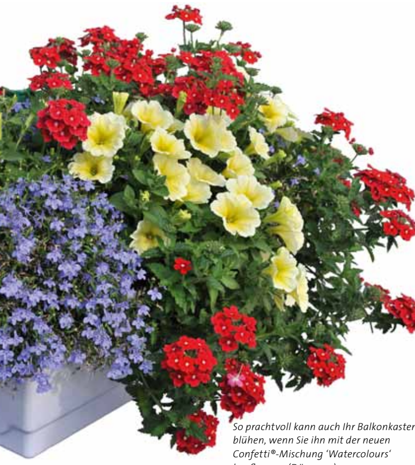
So prachtvoll kann auch Ihr Balkonkasten blühen, wenn Sie ihn mit der neuen Confetti®-Mischung 'Watercolours' bepflanzen. (Dümmen)