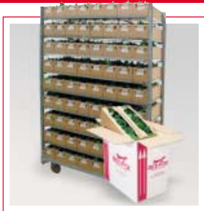
Bien arrivés ...