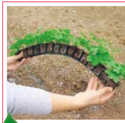
... Avec plaisir!