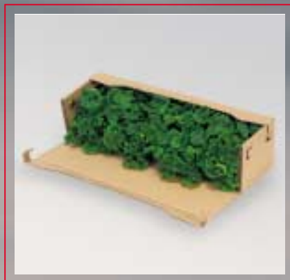
... Tous ensemble ...