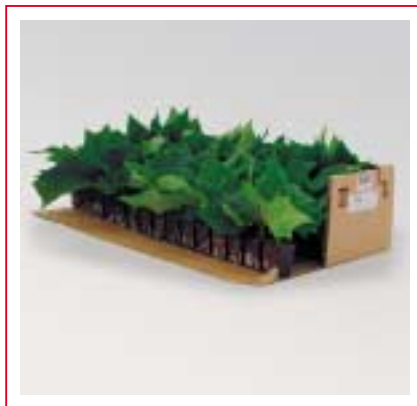
... Tout le monde descend ...