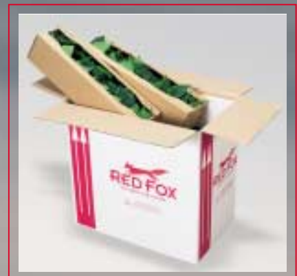
... und los geht's!