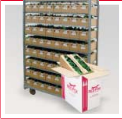
Gut angekommen ...