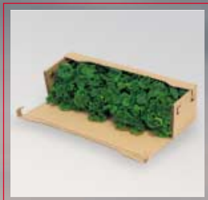
... zusammenrücken ...