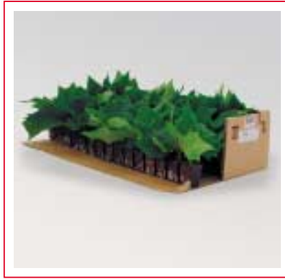
... aussteigen ...