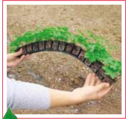
... hinein ins Vergnügen!